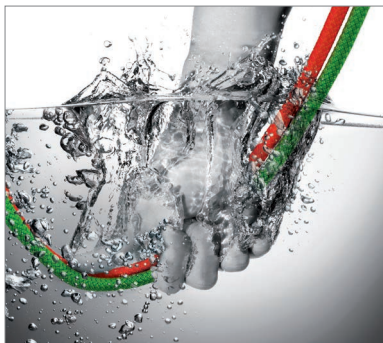
Водопопиваемост на въжетата съгласно процедура на тестване UIAA WATER REPELLENT

UIAA наскоро въведе нов стандарт за тестване и измерване на водопопиваемостта на въжетата. Всички въжета, успешно издържали теста, получават сертификация UIAA WATER REPELLENT. BEAL има удоволствието да Ви съобщи, че всичките 13 въжета Golden Dry на BEAL успешно покриват изискванията на стандарта UIAA Water Repellent и това са първите въжета, сертифицирани по този стандарт.